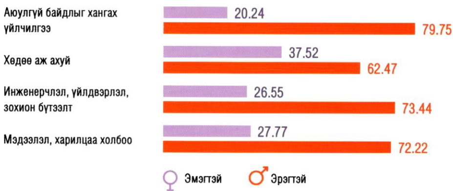
График 3. Эмэгтэйчүүдийн оролцоо дутагдаж буй салбар

Дээд боловсролын сургалтын байгууллагад суралцаж буй суралцагчийн 59 хувь нь эмэгтэй, 41 хувь нь эрэгтэй байна. Хэдийгээр дээд боловсрол эзэмшиж байгаа эмэгтэйчүүдийн тоо эрэгтэйчүүдээс өндөр байгаа ч зарим мэргэжлийн хөтөлбөрүүдэд нэг хүйсийн хэт давамгайлал нилээд байгааг анхаарах шаардлагатай байна.